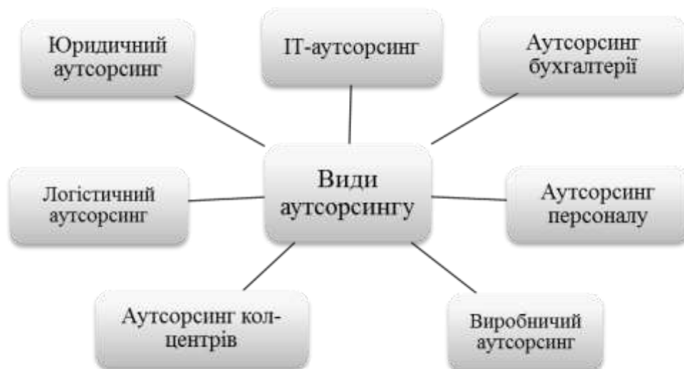
Рис. 2. Найбільш популярні види аутсорсингу в світі

Найбільш поширені бізнес процеси, що передаються на аутсорсинг в світі представлені на рис. 2.