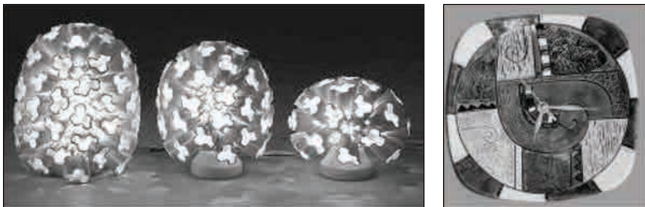
Рисунок 6. Декоративні керамічні предмети побуту (світильники, годинник).

бра, світильників та ін.), які в руках майстрів перетворюються в твори декоративного мистецтва, що виконують не тільки утилітарні, але і естетичні функції (Рис. 6).