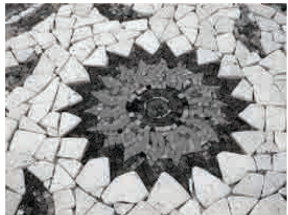
Рисунок 2. Фрагмент керамічної мозаїки.