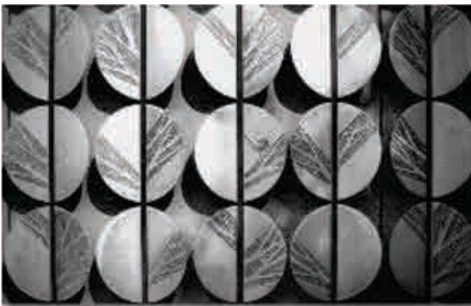
Рисунок 1. Настінне панно.

Керамічні панно і об'ємно-просторові композиції беруть безпосередню участь у вирішенні проблем оформлення інтер'єрів. У панно постійно переплітаються прагнення до використання нетрадиційних для кераміки засобів вираження з бажанням зберегти специфіку матеріалу. Об'ємно-просторові композиції при створенні кольорово-пластичних об'ємів для архітектурного середовища, вдало взаємодіють з певним простором і малими архітектурними формами.