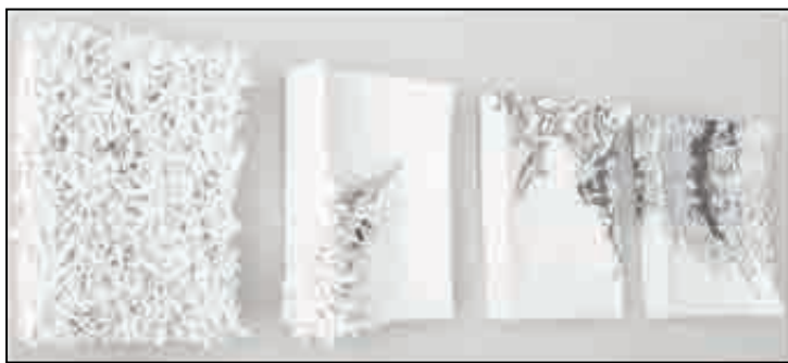
Рисунок 3. Декоративні настінні панно.

У залежності від архітектурного задуму панно можуть становити самостійну композицію або складати одне ціле з фактурою і обробкою стіни. У керамічних панно особливо помітне прагнення до площинності, стилізованості зображення, так як в цьому матеріалі найважче добитися ілюзії простору (Рис. 3). У групі керамічних панно найбільш перспективні «модульні» композиції, які користуються все більшою популярністю та здатні органічно входити в ритмічні структури сучасних інтер'єрів, такі панно часто використовують у створенні декоративних перегородок або декоруванні значної частини стіни [3] (Рис. 4).