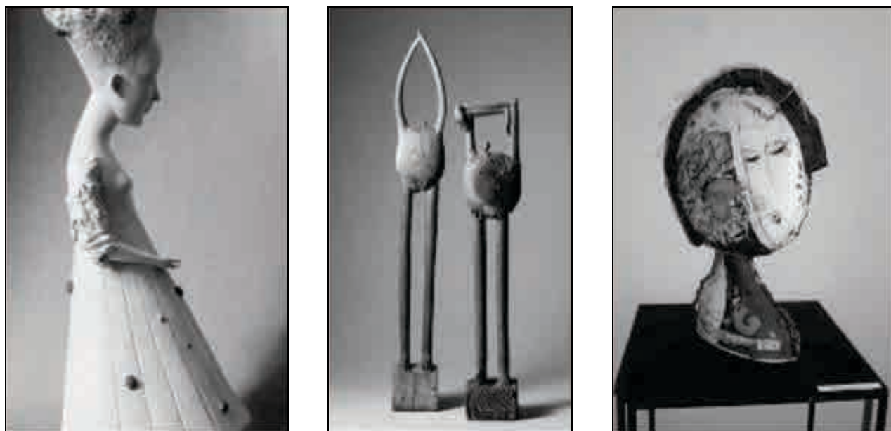
Рисунок 5. Сучасні керамічні скульптури.

Сучасна скульптура до традиційних бюстів, фігур додала різні абстрактні, модерні та концептуальні речі, конструкції і взагалі незрозумілі предмети, які, безсумнівно, виконують естетичні функції, але не відповідають традиційним уявленням про скульптуру. Є гра форм, ритмів, кольорів, фактур, зорових асоціацій, емоцій, динаміки і настрою, філософії, логіки та абсурду (Рис. 5).