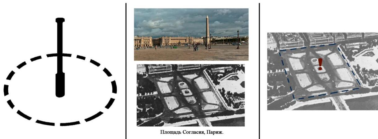
Рис.2. Площадь Согласия в Париже (арх. Анж Жак Габриэль, 1755 г.).

Площадь Согласия в Париже, спроектированная архитектором Габриэлем в 1755 г. не застроена по периметру зданиями, давая возможность любоваться красотами города, переключаясь с ними. На площади установлен луксорский обелиск Рамсеса II из египетского храма. Для визуальной организации пространства архитектору требовались зрительные акценты ровно посередине каждой стороны площади. На востоке таким акцентом стал выход из сада Тюильри, оформленный двумя конными статуями, на юге – мост через Сену (дворец на противоположном берегу появился позже), а на западе – перспектива Елисейских Полей.