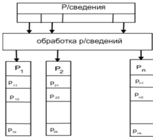
Рис. 1. Порядок обробки розвідувальних відомостей

Представимо ситуацію як модель (абстракцію) реального стану цієї "області". Адекватність такої моделі безпосередньо залежить від числа параметрів (характеристик), що враховуються, і повноти (точності) їх опису.