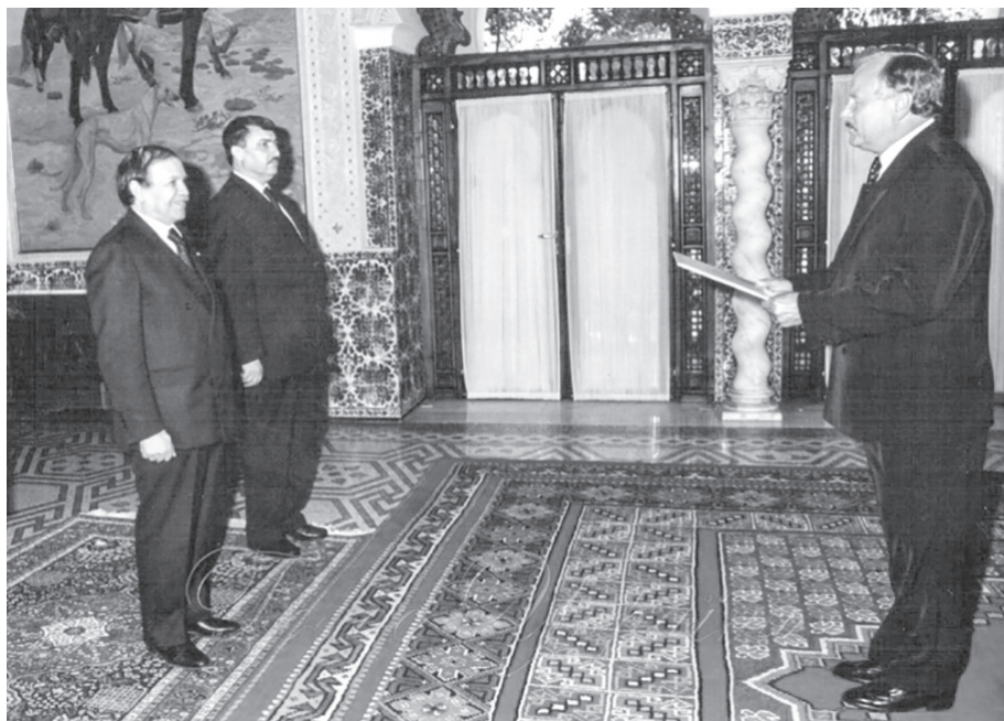
Вручення Вірчих грамот президенту Алжиру Presenting the Credentials to the President of Algeria

рців була робочим днем. — Авт. ) Послів не попередили заздалегідь, тож де-хто з них виїхав зі столиці, а хтось був за кордоном... Таких послів виявилось двоє. Були й такі, Вірчі грамоти яких були закриті у сейфі, ключ від якого був у співробітника посольства, що залишив Алжир і не збирався повертатися до понеділка. Коли посол інформував про це директора департаменту протоколу, то після консультацій із секретаріатом президента було вирішено, що він теж має їхати в Президентський палац, але вручатиме президенту лише порожню папку, не розкриваючи її, про що буде попереджений А. Бутефліка.