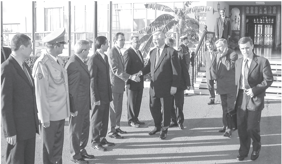
Проводи Міністра закордонних справ України Анатолія Зленка після завершення його офіційного візиту до Алжиру

Візит міністра тривав з 13 до 15 грудня 2002 року. За цей час було підбито підсумки першого десятиріччя відносин між незалежною Україною та АНДР. Було підписано Конвенцію про уникнення подвійного оподаткування доходів і майна та запобігання ухиленню зі сплати податків. Міністр закордонних справ України взяв участь у роботі українсько-алжирського бізнес-форуму, що відбувся у рамках роботи української експозиції, який допоміг започаткувати прямі контакти між підприємцями двох країн. Було досягнуто домовленість про створення Ділової ради.