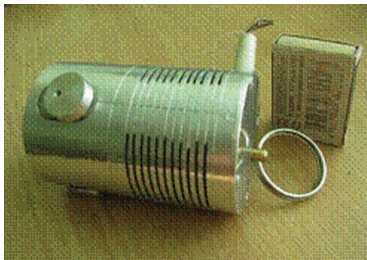
Рисунок 5 – Внешний вид опытного образца № 4

Кинематическая схема разработанного опытного образца, оснащенного менее сложным механизмом фиксации штока, надежной системой ручного деблокирования, представлена на рис. 6.