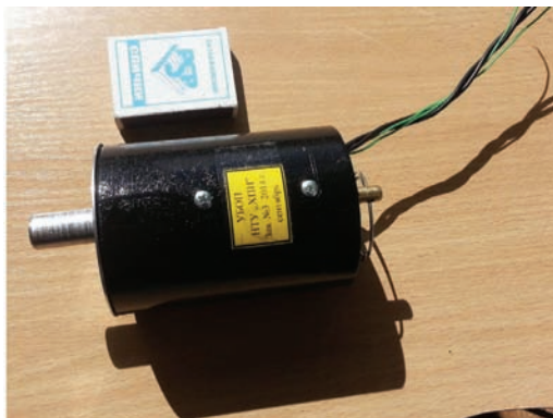
Рисунок 4 – Внешний вид опытного образца № 3

Одним из пожеланий заказчика является использование в качестве крепежных элементов двух винтов М5, проходящих в осевом направлении корпуса УБОП и входящих в резьбовые отверстия на неподвижной части привода коммутирующих устройств. Для осуществления такой возможности и устранения недостатков опытных образцов № 1 и № 2 разработан опытный образец № 3. Внешний вид показан на рис. 4.