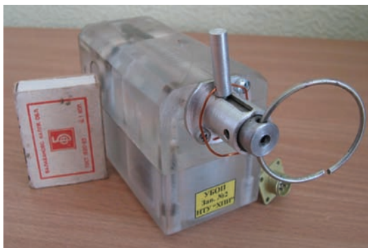
Рисунок 3 – Внешний вид опытного образца № 2

Опытный образец № 2 разрабатывался одновременно с образцом № 1. Его внешний изображен на рис. 3.