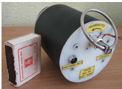
Рисунок 1 – Внешний вид опытного образца № 1

Внешний вид опытного образца №1 представлен на рис. 1.