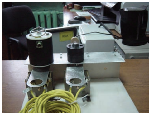
Рисунок 2 – Испытательный стенд

Испытательный стенд, на котором проводились экспериментальные исследования изображен на рис. 2.