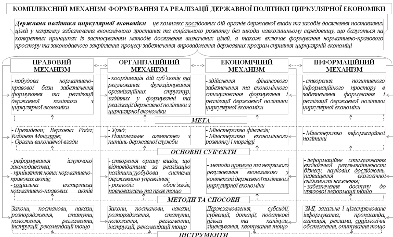
Рис.3. Комплексний механізм формування та реалізації державної політики циркулярної економіки

Кожен механізм як складова комплексної системи формування та реалізації державної політики у сфері циркулярної економіки складається із системи елементів та системи об'єктів управління. В процесі взаємодії правового, організаційного, економічного та інформаційного механізмів формування та реалізації політики циркулярної економіки забезпечується комплексне управління процесом трансформації економіки до циркулярного типу. Комплексний механізм формування та реалізації державної політики в сфері циркулярної економіки із зазначенням мети кожної складової, суб'єктів забезпечення її, методів, засобів та інструментів реалізації наведено на рис.3.