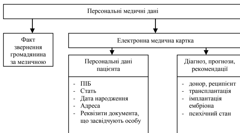
Рис. 1. Структура персональних медичних даних

Одним з розповсюджених підходів до захисту інформаційних систем є використання дискреційної політики безпеки, яка володіє відносно простою реалізацією механізмів захисту інформації [5]. Основою такої політики є керування розмежуванням доступу до ресурсів МІС. Принципи дискреційної політики визначаються правилами, згідно яким розподіляються права доступу до об'єкту між ідентифікованими суб'єктами. Особливо актуальною проблема розмежування доступу є по відношенню до МІС, оскільки в ній циркулює конфіденційна інформація. Цілком логічно, що певні суб'єкти (пацієнти, лікарі) повинні мати чітко визначені права на той чи інший об'єкт. Правила розподілу прав доступу і аналіз їх впливу на МІС можна описати за допомогою моделі Take-Grant. Дана модель підтверджує чи компрометує ступінь захисту інформаційної системи і представляє її у вигляді направленого графа, в якому показані правила доступу суб'єктів до об'єкта. Формально описати модель Take-Grant можна наступним чином: представимо сукупність об'єктів, а саме ПМДн в вигляді множини P = (p_1, p_2, \dots, p_n) . Схематично структуру ПМДн можна зобразити наступним чином рис.1.