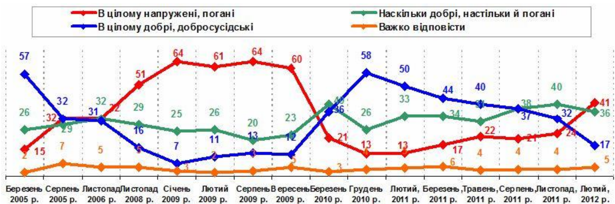
Рис. 1 Оцінка стану міждержавних відносин України і Росії, % до опитаних. Дані Research & branding group ( www.rb.com.ua ).

Отже, майже половина українців вважає відносини з Росією «поганими та напруженими», тоді як у цілому добрими і добросусідськими – 17 %. Очевидним є падіння останнього показника: від майже 60 % респондентів, які позитивно оцінювали якість українсько-російських відносин наприкінці 2010 р., до нинішнього зниження практично втричі (рис. 1).