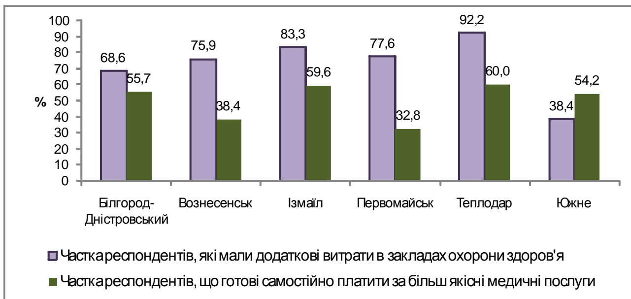
Рис. 3. Частка респондентів, які мали додаткові витрати в закладах охорони здоров'я, і які готові платити за більш якісні медичні послуги

Попри те, що найвищий закон України – Конституція – гарантує громадянам отримання безкоштовної медичної допомоги, на практиці виявляється, що часто ця гарантія має декларативний характер. Так, загалом 73,0 % опитаних мали додаткові витрати в лікарнях, поліклініках і на прийомі в сімейного лікаря. Найвищим цей показник виявився у м. Теплодар та м. Ізмаїл – 92,2 % і 83,3 % відповідно (рис. 5). Не дивно, що саме в цих містах більшість респондентів готові самостійно й офіційно платити за більш якісні медичні послуги (у м. Теплодар – 60,0 %, у м. Ізмаїл – 59,6 %).