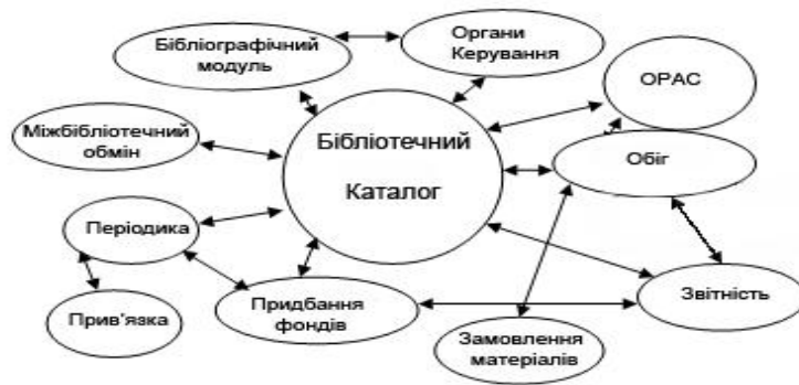
Рис. 1. Типові складові модулі АБІС [3]

Поступово системи АБІС розширюються, набувають нових функцій та отримують нові модулі від розробників. Вони можуть містити в собі веб-модулі (інтернет-сервери) для організації доступу користувачів через мережу Інтернет до ресурсів бібліотеки та її партнерів; інструменти для використання можливостей Інтернету в розвитку структури бібліотеки та налагодження міжбібліотечної взаємодії; засоби для входження бібліотеки до корпоративних або асоціативних міжбібліотечних систем [5].