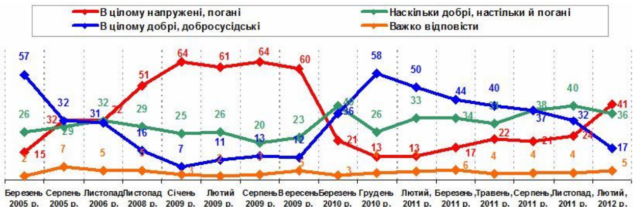
Рис. 1 Оцінка стану міждержавних відносин України і Росії, % до опитаних. Дані Research & branding group ( www.rb.com.ua ).

Отже, майже половина українців вважає відносини з Росією «поганими та напруженими», тоді як у цілому добрими і добросусідськими – 17 %. Очевидним є падіння останнього показника: від майже 60 % респондентів, які позитивно оцінювали якість українсько-російських відносин наприкінці 2010 р., до нинішнього зниження практично втричі (рис. 1).