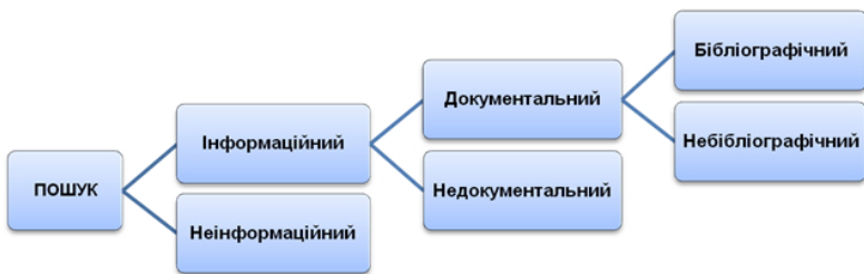
Рис. 2. Дихотомічна класифікація пошуку

Бібліографічний пошук є різновидом документального та інформаційного пошуку (рис. 2). Пошук загалом – це діяльність, спрямована на знаходження того чи іншого об’єкта, явища, речі серед інших та його порівняння з потребою, що спонукала до пошуку. Застосовуючи дихотомічну класифікацію (логічну процедуру поділу обсягу поняття на два види поняття, що суперечать одне одному), пошук поділяють на інформаційний та неінформаційний пошук залежно від об’єкта пошуку.