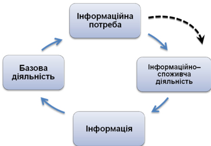
Рис. 1. Виникнення та задоволення інформаційної потреби

У процесі інформаційного пошуку дуже важливе значення має пошукова ознака чи набір пошукових ознак, за якими ведеться пошук інформації. Ознака – це властивість об’єкта, яка обумовлює його відмінні або спільні риси з іншими об’єктами. Пошуковий образ документа (ПОД) – це набір пошукових ознак, які характеризують документ і є потрібними для пошуку та ідентифікації документа відповідно до запиту. Наприклад, пошуковим образом документа можна вважати бібліографічний запис.