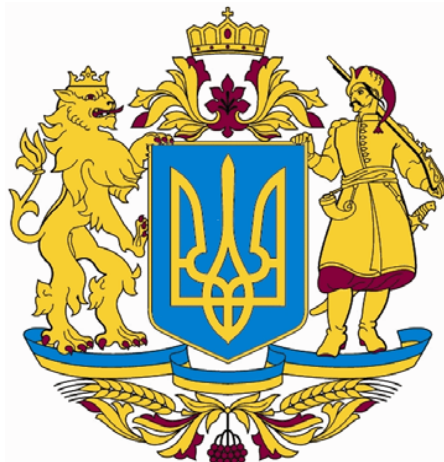
Проект великого герба України авторського колективу О. Івахненка (2009)

Як відомо, 18 липня 2009 р. Кабінет Міністрів України затвердив Положення про великий Державний герб України і парламент мав розглянути його вже у вересні або на початку жовтня цього ж року. Уряд ухвалив як великий герб проект колективу О. Івахненка, що є доопрацюванням попередніх кількох проектів і відрізняється від них суто косметично. Проект включав зображення малого герба в центрі, по боках від нього – фігури лева і запорізького козака, знизу – синьо-жовта стрічка, а зверху – княжа корона. На жаль, у проекті залишився ряд помилок і неточностей, тому його так і не було внесено на розгляд Верховної Ради України.