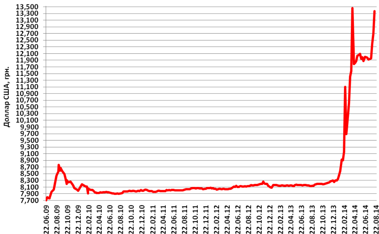
Средний курс продажи наличного доллара США в Украине

Средний спред по операциям с наличным долларом в Украине за прошлую неделю снизился на 1,74 % до 5,03 %, что стало результатом резких девальвационных скачков и повысило опасения населения относительно дальнейшей динамики гривни.