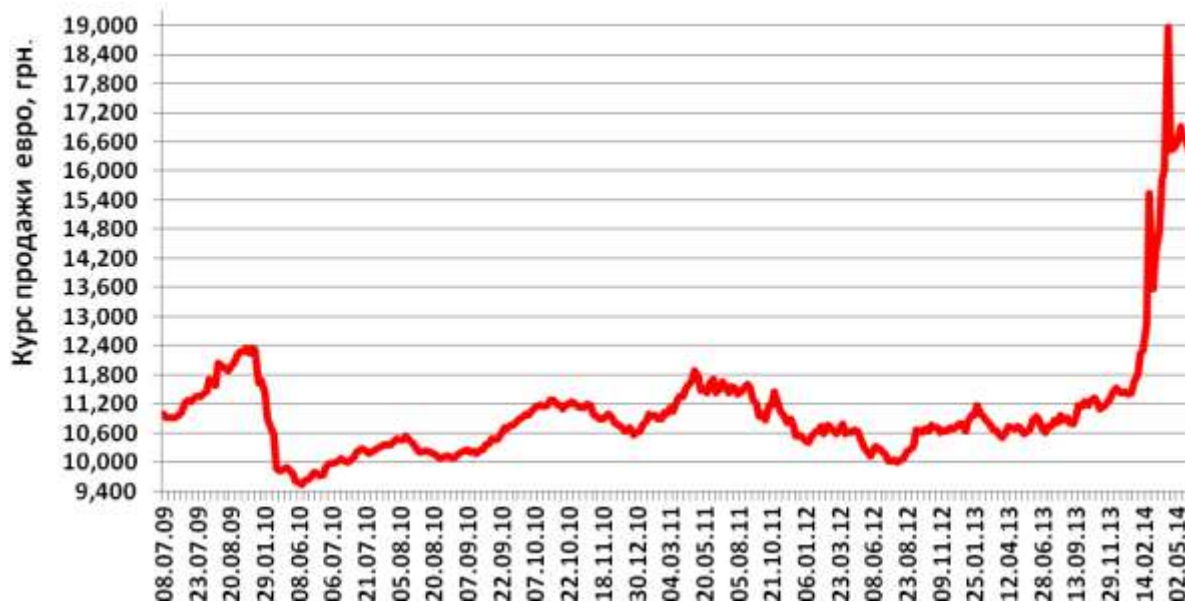
Средний курс продажи наличного евро в Украине