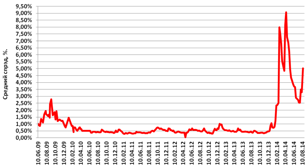
Средний спрэд по наличным операциям с долларом США

Объем ОВГЗ, которые принадлежат нерезидентам, за прошедшую неделю вырос на 4,08 % до 17,918 млрд грн. Такая динамика может быть обусловлена последними заявления главы НБУ о скором укреплении гривни.