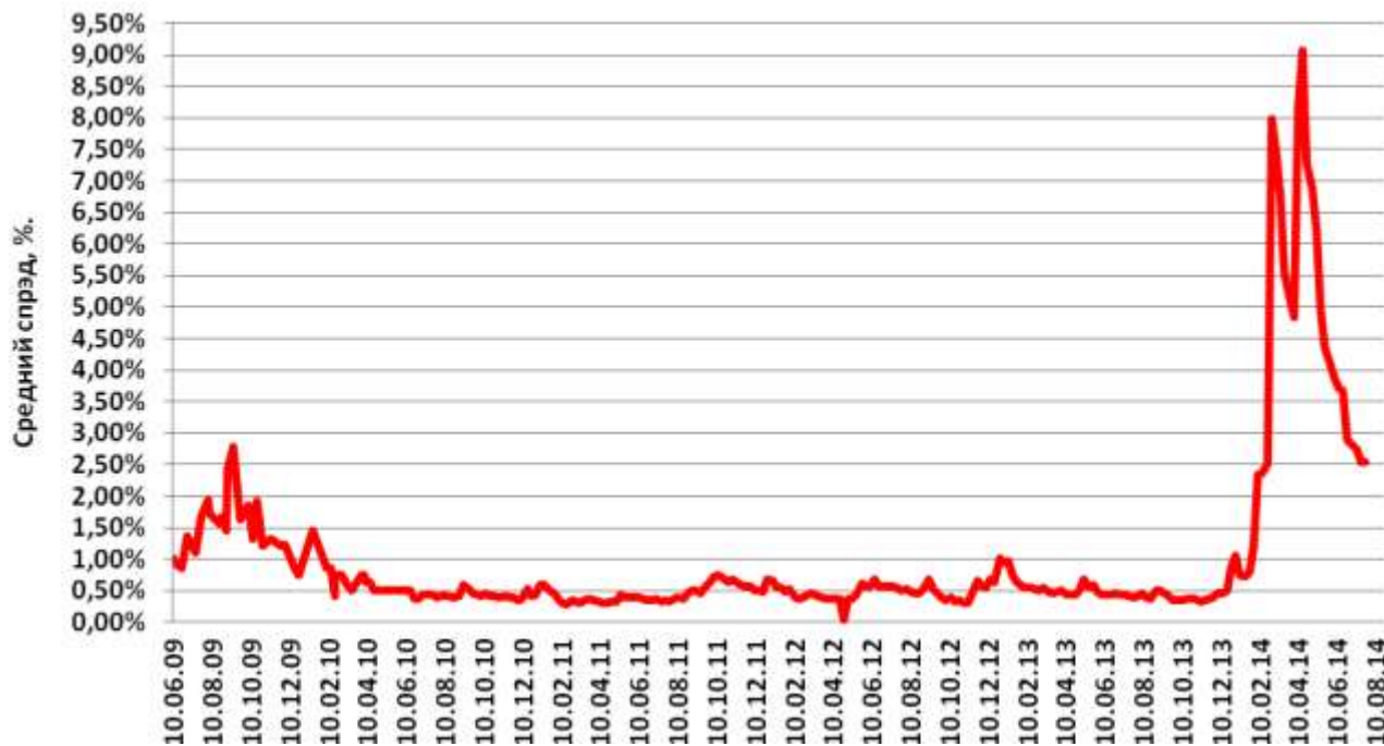
Средний спред по наличным операциям с долларом США