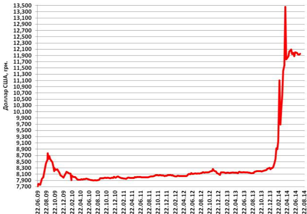
Средний курс продажи наличного доллара США в Украине

Средний размер спреда по наличным операциям с долларом США за июль повысился на 0,33 % до уровня 3,22 %, что свидетельствует о наличии опасений относительно стабильности валютного рынка и повышении девальвационных настроений населения.