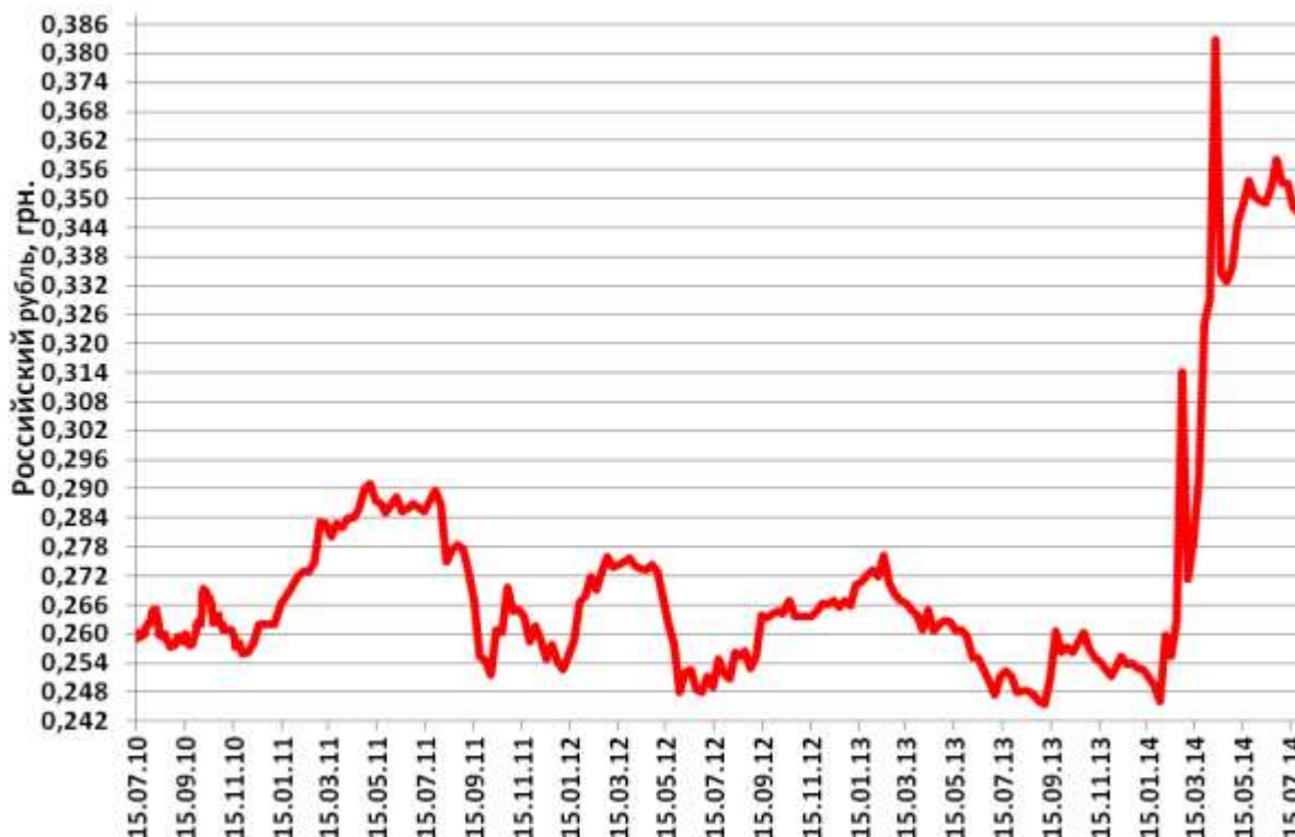
Средний курс продажи наличного российского рубля в Украине